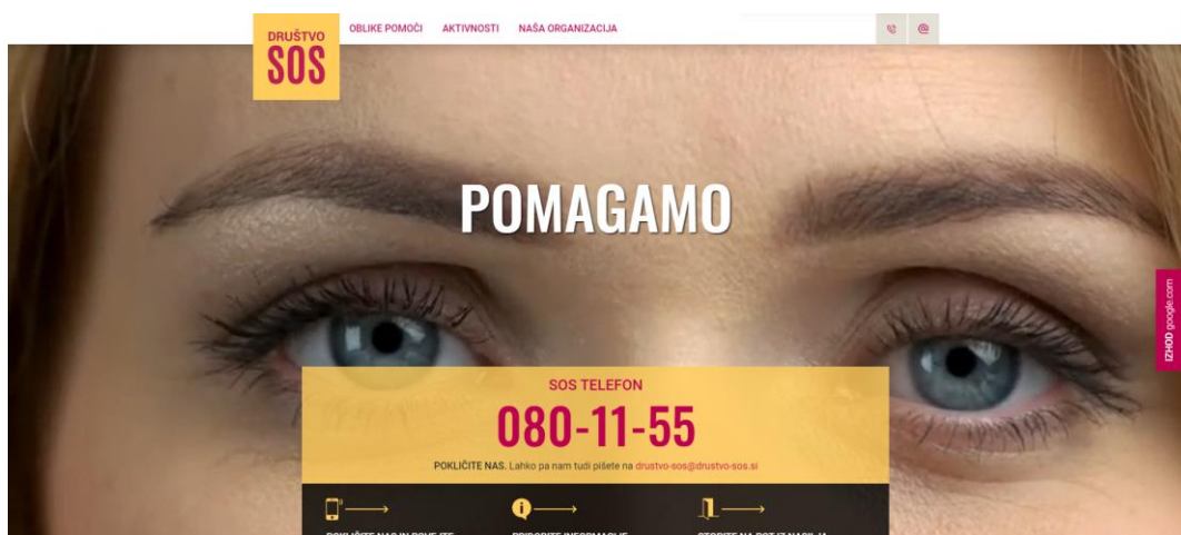
Slika 1: Trenutna začetna stran Društva SOS

Društvo SOS trenutno promovira svoje storitve, med drugim, seveda s spletno stranjo [3]. Trenutno stanje ni idealno, saj je vsebina nelogično razdeljena in nepregledna. Začetna stran je zelo neprijetna za žrtve nasilja, ki so znane po tem, da pomoč težko iščejo in se očesnemu stiku izogibajo. Na spletni strani pa je to prvo kar jih pričaka.